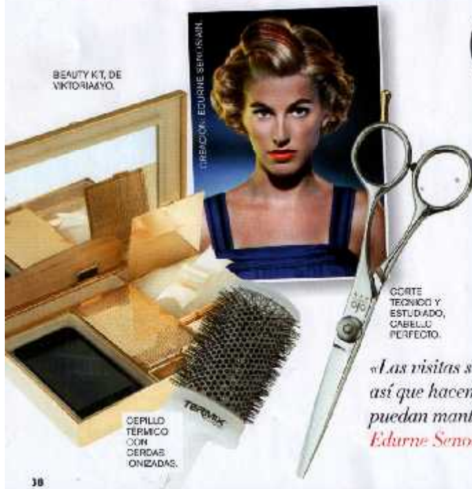
DIRECCIÓN: EDURNE SENOSIAIN